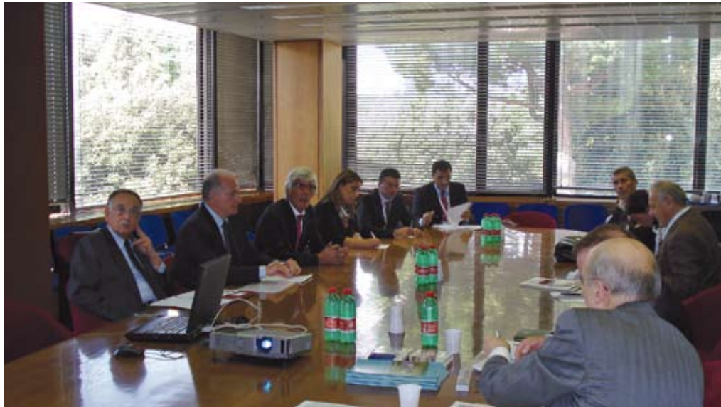
Incontro organizzato dall'affiliata italiana Anepla, presso la sede centrale di Confindustria a Roma

Il Comitato ha stretto un rapporto di cooperazione con i produttori di macchinari per migliorare l'equipaggiamento in termini di sicurezza; mentre dal punto di vista della salute, uno dei risultati più importanti è stato l'accordo sociale stipulato con la Commissione Europea in merito al problema della silice cristallina libera.